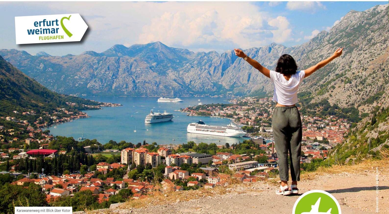
Karawanenweg mit Blick über Kotor