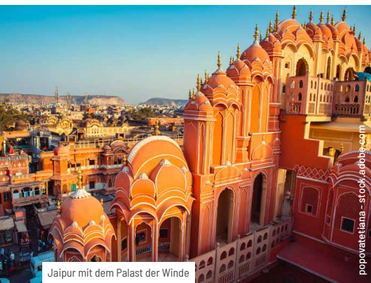
Jaipur mit dem Palast der Winde