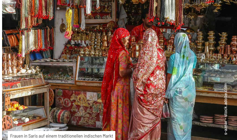
Frauen in Saris auf einem traditionellen indischen Markt