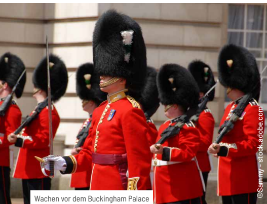
Wachen vor dem Buckingham Palace