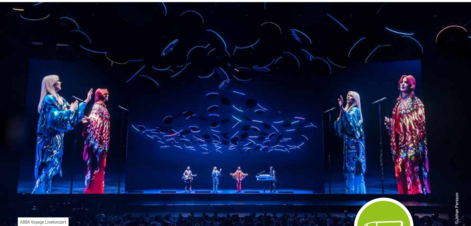
ABBA Voyage Livekonzert