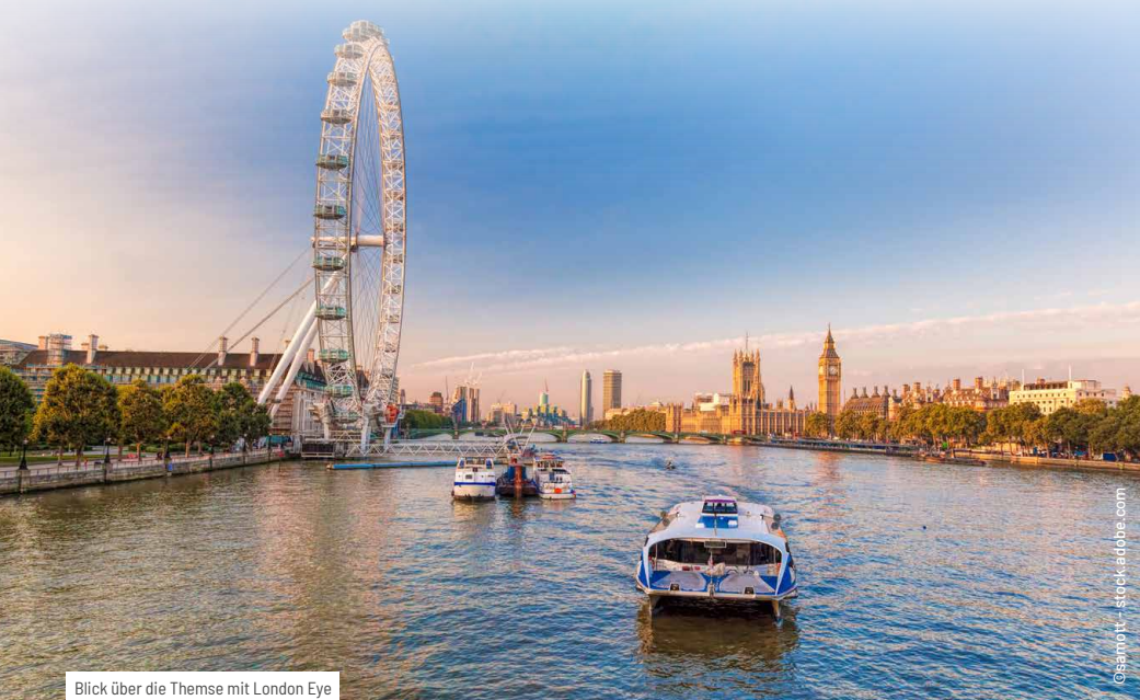
Blick über die Themse mit London Eye

Englands berühmteste Kirche ist der Ort von Krönungen und Begräbnissen britischer Monarchen, darunter Elizabeth I. und Maria Stuart.